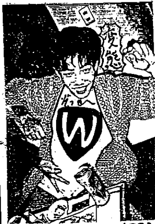
KONDSYASINWA YOPPA RATTAZZIKRANOWATANA BEKUNAWO DECELESYASINBA

祝! WK. 240KM/h達成!! 祝! U氏合格!!! 2台目 23 ヤレンジ!!! 表紙ワタシ. 個人のオトナの型式を 当てて下さい! 望の KISS